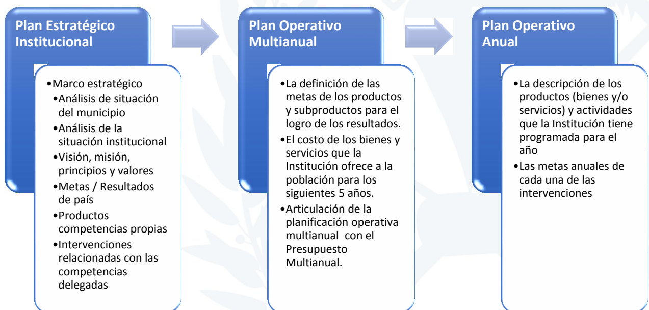
Figura 3. Proceso de planificación de las Municipalidades

El Plan Operativo Anual (POA) es un instrumento de gestión operativa el cual plantea la programación de los productos institucionales (bienes y/o servicios) de competencias propias o las intervenciones que responden a las competencias delegadas, derivado de la planificación y programación Multianual (POM) y que se realizarán durante el período fiscal de un año (2021), en concordancia con las prioridades y resultados de País, los lineamientos generales de política y otros planes según corresponda a la municipalidad.