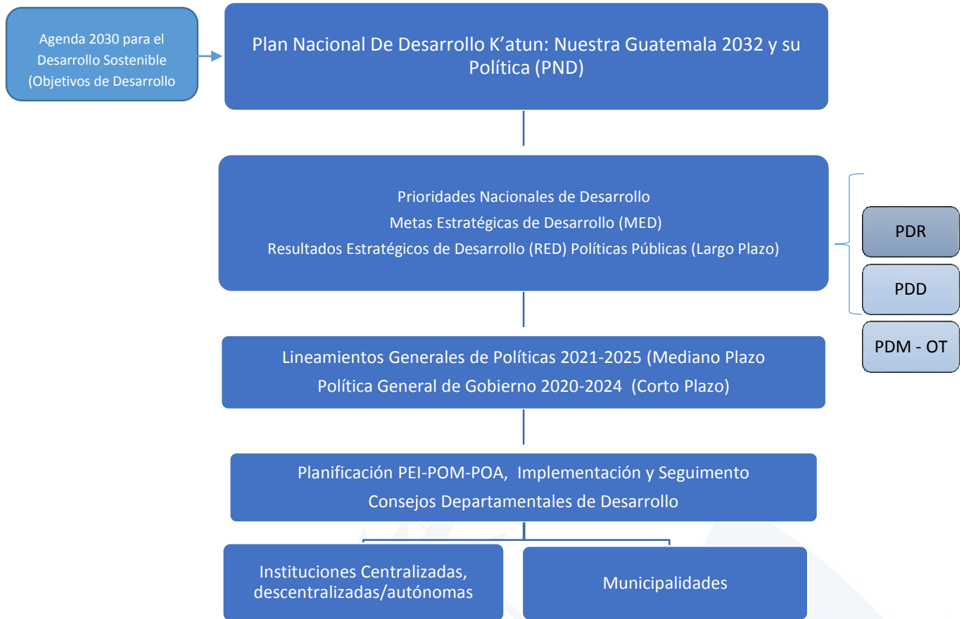
Figura 2. Relación del proceso de planificación en sus diferentes niveles, implementación y seguimiento